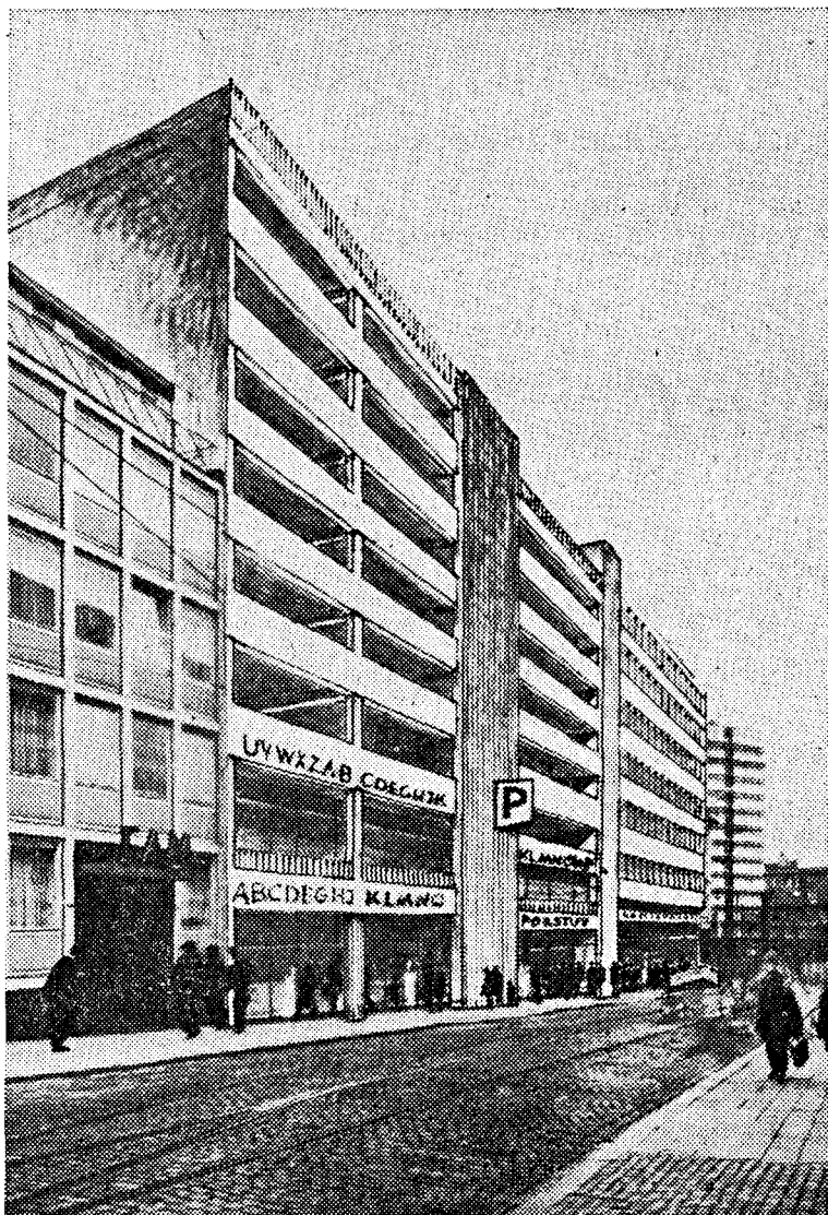
Ein geschickter Zeichner hat im Bild dargestellt, wie sich das an der Kölnischen Straße geplante Parkhaus später einmal zwischen dem EAM-Gebäude (links) und dem Neubau der Kreissparkasse (hinten) einfügen wird. Die Straßenfront des etwa 24 Meter hohen Baus wird durch ein Treppenhaus, das sich als betonende Senkrechte zwischen die gegeneinander halbgeschossig versetzten Parketagen stellt, aufgelockert.

Beat für Biafra. Für die Jugend des katholischen Dekanats Kassel veranstaltet die Fatima-Gemeinde Wilhelmshöhe (Memelweg) am heutigen Samstag (11. 1.) einen Tanzabend mit der Band „The Crew“ (Beginn 19 Uhr). Der Reinerlös ist für die Bevölkerung in Biafra bestimmt. (knx)